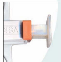
FERMO DI SICUREZZA SAFETY BLOCK

Drape 60x60 cm (2) • Formaline 10% 10 ml • Stirring rod • Gauzes 7.5x7.5 cm (10) • Adhesive bandage • Scalpel • Gauze sponges (3) • Forceps • 10 ml syringe with hypodermic needle 19Gx38 mm (pre-filtered) and 21Gx38mm • Lidocaine 2% 10 ml • Instant ice